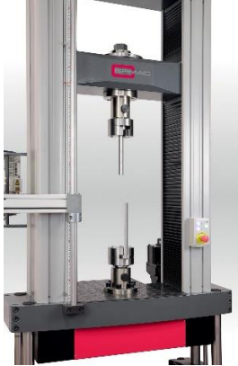
Teste ad innesto