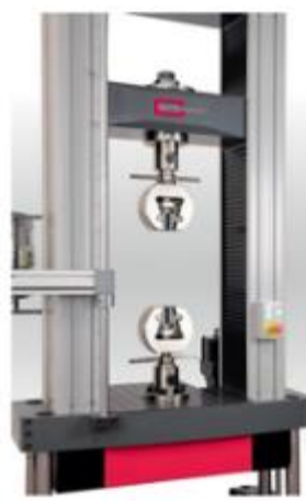
Ganasce manuali, Pneumatiche o idrauliche