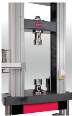
Teste a spalla