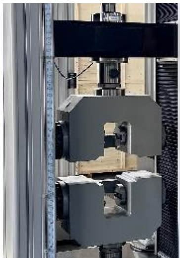
Afferraggi idraulici ad azionamento orizzontale