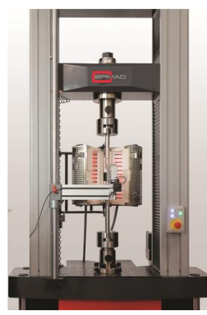
Prove a caldo