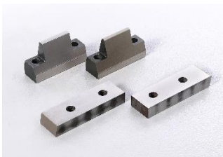
Coltello ed Appoggi