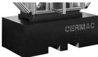
Plinto in Calcestruzzo