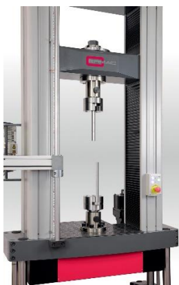
Teste ad innesto