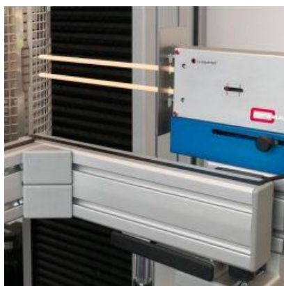
Estensimetro a contatto